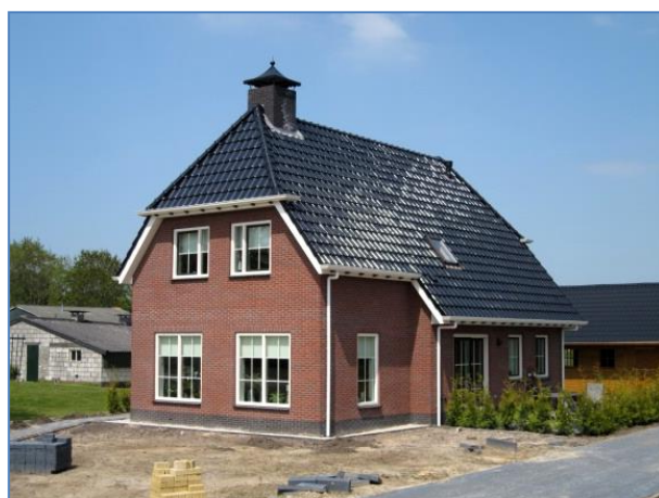
Door U. Veenstra reeds gerealiseerde woningen